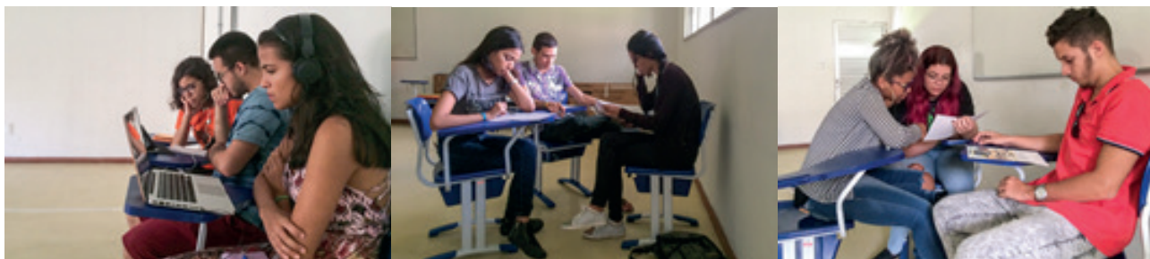
Figura 01, 02 e 03: alunos assistem vídeos, lêem textos e observam obras de arte criadas no período da ditadura.

Na segunda estação, os alunos analisavam e debatiam imagens de obras de arte que retratavam a ditadura militar no Brasil, como a "Red Shift" de Cildo Meireles, obra exposta no museu do Inhotim que denota desde a violência do período até posicionamentos ideológicos. Na terceira estação, utilizando computadores e tablets, os alunos assistiram uma reportagem sobre a repressão do governo e a resistência dos artistas. Ao final do percurso em cada uma das estações, juntos, os alunos ouviram uma música que criticava a censura exercida pelos militares nos anos 70.